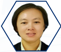
7-PUAN CHIN CHIEN PING GRED F10 KEMENTERIAN PENDIDIKAN MALAYSIA