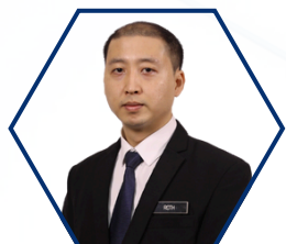
21-YBRS. Ts. ROTH CAMDESSUS ANAK ROBERT GRED F10 JABATAN DIGITAL NEGARA